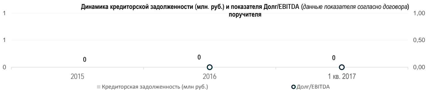
График строится для всех Поручителей принятых в качестве основного обеспечения по договору.

В случае если договором для Заемщика установлено несколько расчетных финансовых ковенант, они отдельно указываются на дополнительном графике.